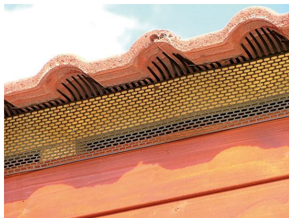
Ochranná větrací mřížka jednoduchá

Ochranná větrací mřížka se přibíjí na okapovou lať (první lať na okapové hraně) pomocí hřebíků ve vzdálenosti cca 10 – 15 cm