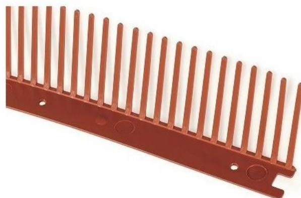
Ochranná větrací mřížka jednoduchá